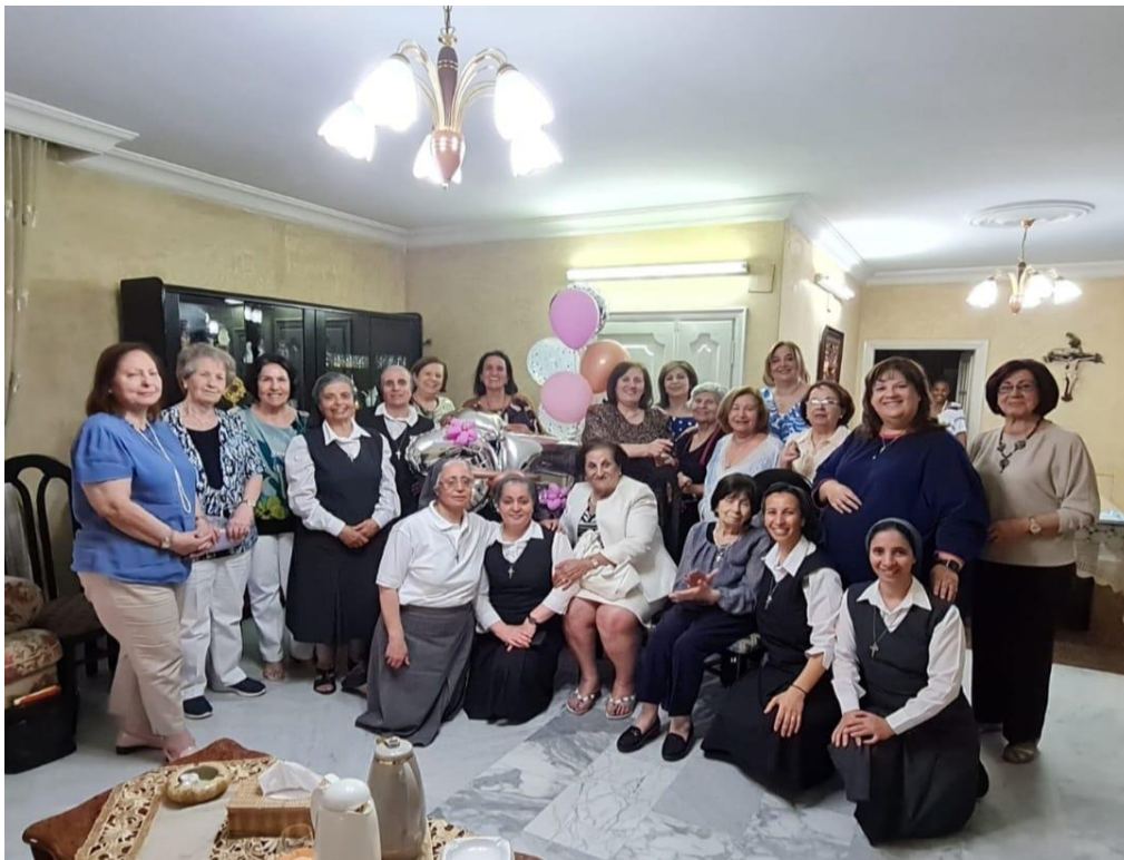
Une amie de Sainte Emilie Jordanie

Et que les amis d'Émilie de Vialar soient comblés de toutes sortes de bienfaits