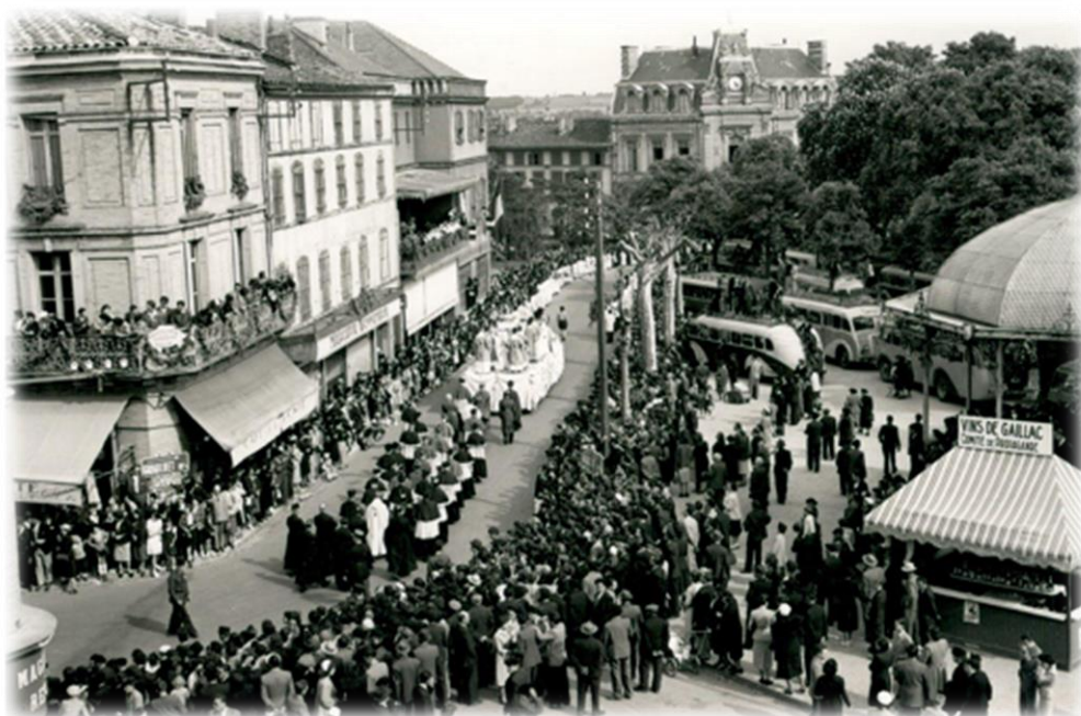
Procession à Gaillac, mai 1952