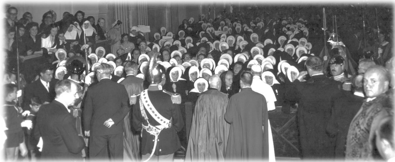
Au départ de Saint-Pierre

Aussitôt, les cloches de Saint-Pierre et des églises voisines se mirent à sonner. Elles faisaient écho à la gratitude et à la joie des personnes présentes et de celles qui écoutaient partout dans le monde.