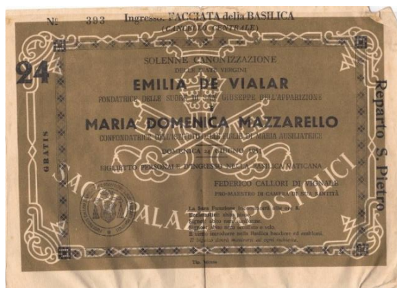
Invitation à la canonisation

La canonisation de la bienheureuse mère fondatrice sera célébrée dans le cadre d'une double cérémonie. Deux fondatrices, la bienheureuse Émilie de Vialar et la bienheureuse Marie Mazzarello, fondatrice salésienne